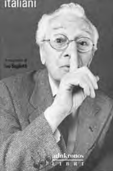
本「イタリア人のジェスチャー」