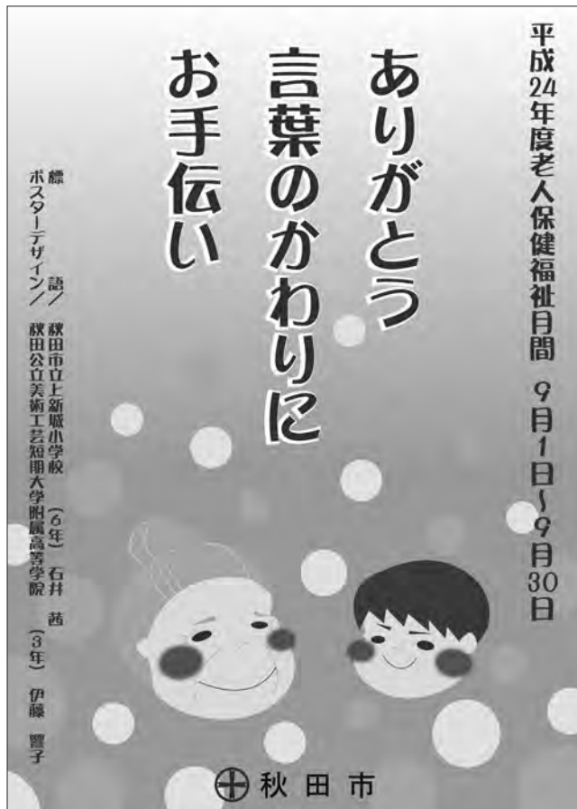
今年度の老人保健福祉月間の標語とポスターデザイン

一人ひとりが高齢者や高齢社会について関心と理解を深め、誰もが生きがいをもち健康に生活できる長寿社会をめざしましょう。