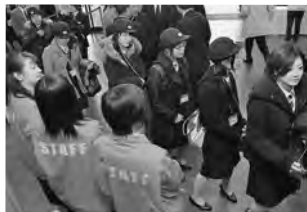
全国の団員をお出迎え

当日は、地元消防団関係者もスタッフとして参加。おもてなしの心で全国から訪れた団員のみなさんに接するなど、大会の円滑な運営をサポートしました。