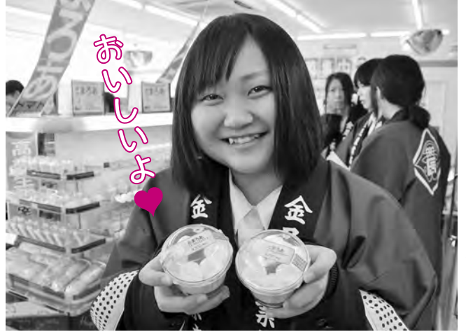
ファミリーマート卸町店でのとまろあ発売イベントで(2月19日)