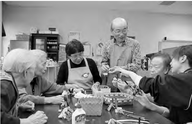
「笑顔でいきいき」。介護支援ボランティア制度の実践現場で(柳田の「本道の街テイスサービスセンター」)