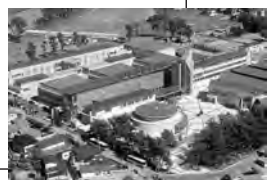
秋田公立美術大学

在宅子育てクーポン券のサービス内容に、大森山動物園の年間パスポート引換券を追加します。クーポン券の申し込みは6月の予定。詳細は改めて広報あきたでお知らせします。 子ども育成課