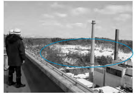
総合環境センター東側にあるメガソーラー建設予定地(緑の円)

● 市役所新庁舎に再生可能エネルギーを導入▼平成25年度は地中熱を利用した融雪設備の工事などを行います …1億1934万円