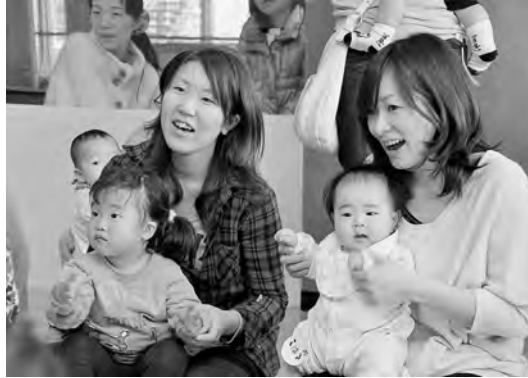
子ども未来センターで(3月14日)

4月から、上記の福祉医療窓口は、障がい福祉課から子ども総務課(本庁舎3階)へ変わりました。申請や問い合わせは子ども総務課子ども福祉医療担当へ。☎(866)8846