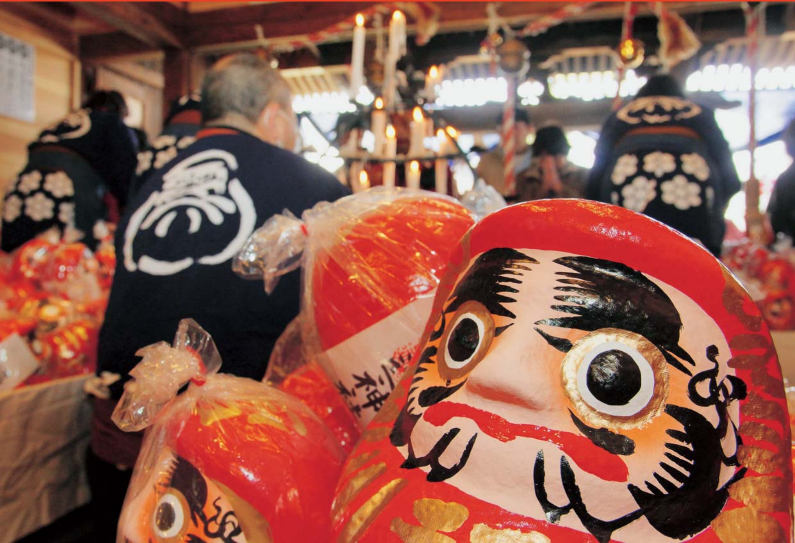
みんなの願い、かなえちゃおっかな〜♪