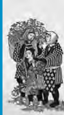
勝平得之(花四題「春」)

赤れんが郷土館 企画展「近代版画の魅力」 常設展「花の歳時記」 観覧料200円(中学生以下無料) ギャラリートーク▶11:00~11:45