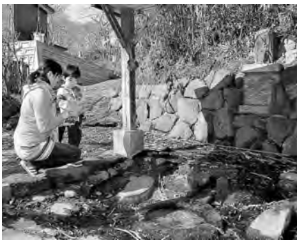
「この湧き水が高清水の名前の由来になったんだね」…高清水霊泉