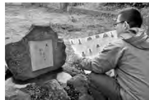
「ここにもあったんだ」(楢山)