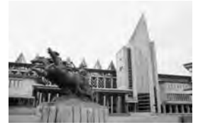
秋田公立美術大学