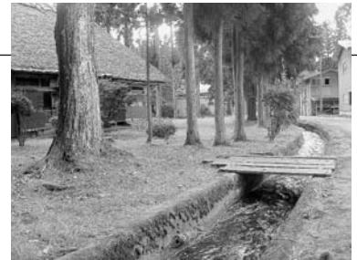
故郷の原風景…鶴養集落の水路

往復はがきまたはEメール(1通で2人まで)で、見学希望日、参加者全員の氏名、年齢、住所、電話番号を書いて、6月3日(月)(必着)まで、〒010-8560秋田市役所広報広聴課 Eメール skengaku@city.akita.akita.jp *電話・ファクスでは受け付けません。就学前のお子さんは不可。