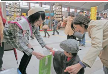
あきた観光レディーもお手伝い

今後は、竿燈まつりや大型観光企画「秋田デスティネーションキャンペーン」(10月～12月)に合わせて行い、秋田の玄関口を盛り上げます。