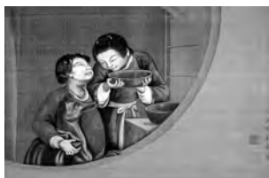
小田野直武「児童愛犬図」

申し込み 6月30日(日)17:00まで 太平山観光開発(株)☎(827)2001