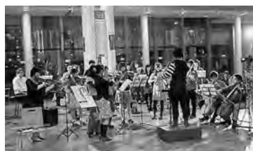
オーケストラの演奏風景