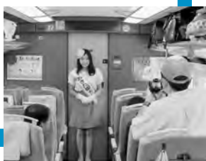
まごころ込めてお出迎え

竿燈まつり期間中、秋田新幹線こまちの車内(大曲～秋田間)で、あきた観光レディーと学生ボランティアが、祭りと秋田市をPR。観光客のみなさんにとても好評でした！