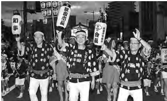
今年も竿燈まつりへのご来場、ありがとうございました