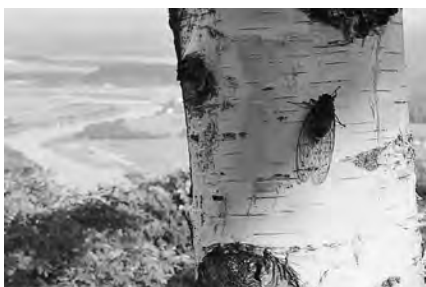
セミの声も遠い昔…。 もうすぐ実りの秋を迎えます

この紙面上にコラムを書くときは、春夏秋冬、いつも発行される頃の季節の風景や空模様を思い浮かべます。9月初旬、まだ残暑はあるでしょうが、一陣のさわやかな初秋の風が、逝く夏を惜しむかのように緑の波となって秋田の大地を吹き抜けていることを心から願っています。