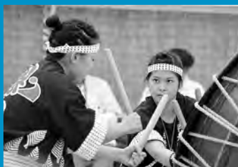
囃子方優勝の秋田県立大学