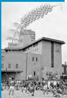
団体自由優勝の柳町