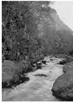
峯谷峡も色づく季節

9月28日(土)9:30~17:00。講義・演習体験、入試相談、テッサン指導など。参加申込は、秋田公立美術大学学生課へ。☎(888)8105