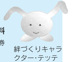
絆づくりキャラクター クター・テッテ