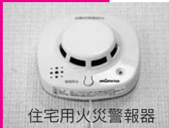
住宅用火災警報器