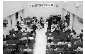
昨年のいこいのコンサート