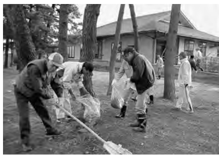
松林の落ち葉を丁寧に集めます