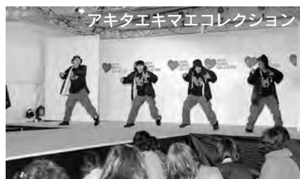
アキタエキマエコレクション