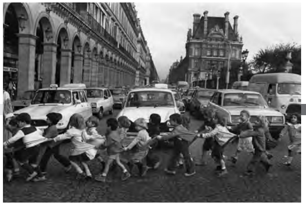
「リヴォリ通りのスモック姿の子供たち」 (1978年) ©Atelier Robert Doisneau

申し込み 11月18日(月)午前9時30分から 千秋美術館 ☎(836)7860