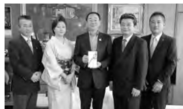
目録の贈呈式で。秋環連のみなさんと穂積市長(中央)