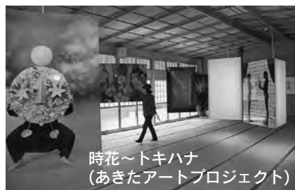
時花～トキハナ (あきたアートプロジェクト)