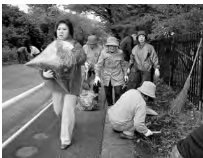
自分のペースで手際よく♪