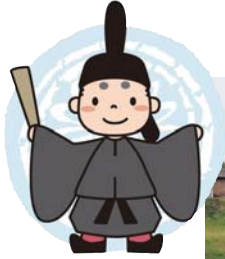
史跡秋田城跡の マスコット キャラクター 「秋麻呂くん」