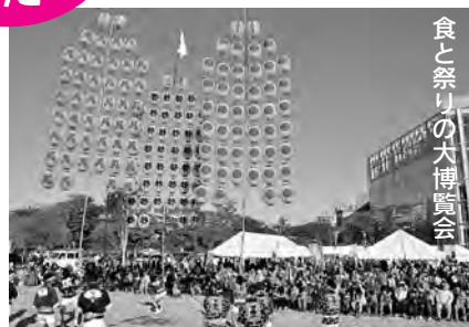
食と祭りの大博覧会