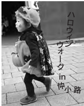
ハロウィン ウォーク in 仲小路