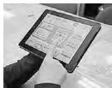
タブレット端末機

総務省の「ICT(情報通信技術)超高齢社会づくり推進事業」として実施する、タブレット端末機(携帯型の情報機器)を活用した生活支援・買い物支援サービスのモニター(協力者)を募集します。モニター期間は3月15日(土)まで。