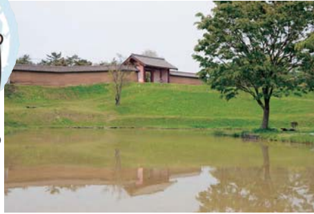
史跡秋田城跡歴史公園