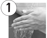
流水で両手を十分濡らす

咳やくしゃみなどによる「飛沫感染」、ドアノブや電気のスイッチなど不特定多数の人が触れるものを介した「接触感染」を防ぐため、帰宅時や食事の前、トイレの後、動物を触った後などは、せっけんと流水で手をよくこすり洗ひましょう。アルコール製剤を使った手指の消毒も効果があります。