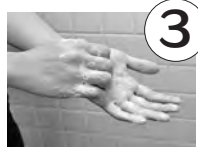
手の平と甲をこすり洗い