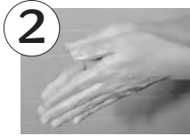
石けんで、手首の5センチまで15~30秒間もみ洗い