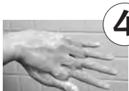
指先や爪は入念に。指の間、親指、手首も忘れずに