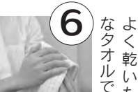
よく乾いた清潔なタオルでよく拭く