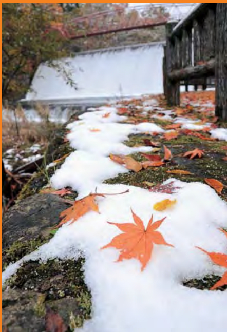
仁別・藤倉水源地(11/12)