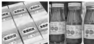
金農納豆 トマトピューレー

11月23日、セリオンリストで、「金農マルシェ」が開かれました。この催しは、秋田市、金足農業高校（金農）、「マルシェ de ポート土崎」の共催によるもので、今年が3回目。中でも、金農の生徒が育てた花や地元産の食材を加工した食品は、毎回お客さんにとっても好評です。この日も、納豆、味噌、鶏卵などは、開店後まもなく完売。販売を担当した生徒のみならず、心を込めて作った農産物が売り切れ、ほっとくと安心の様子でした。