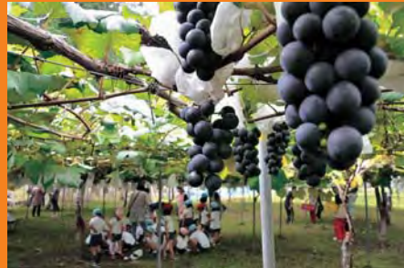
雄和花木観光農園(9/12)