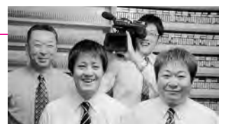
今年も、市政番組をご覧いただきありがとうございました(広報広聴課視聴覚広報担当)