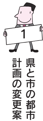
1 県と市の都市 計画の変更案