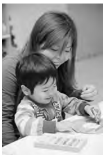
子ども未来センターのつくつチャオ