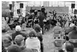
吹奏楽部も会場を盛り上げ！