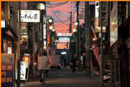
川反すずらん通り(10/3)