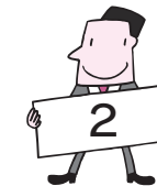
2 市街化調整区域に おける新たな開発 許可基準の条例案