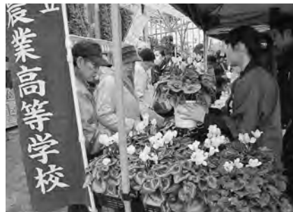
シクラメンの鉢植えも人気！

11月23日、セリオンリストで、「金農マルシェ」が開かれました。この催しは、秋田市、金足農業高校（金農）、「マルシェ de ポート土崎」の共催によるもので、今年が3回目。中でも、金農の生徒が育てた花や地元産の食材を加工した食品は、毎回お客さんにとっても好評です。この日も、納豆、味噌、鶏卵などは、開店後まもなく完売。販売を担当した生徒のみならず、心を込めて作った農産物が売り切れ、ほっとくと安心の様子でした。