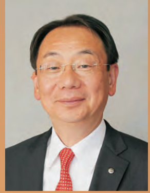
秋田市長 穂積 志 ほづみ もとむ