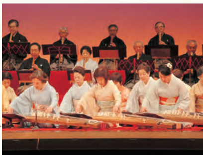
箏、尺八、三味線などの演奏を披露 (昨年9月のイベントで)

また、全国的に活躍するプロのかたも出演します。みなさんも一緒に楽しんでください。