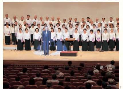
会場が一体となり東海林太郎の歌を合唱 (昨年9月のイベントで)

折しも祭典が行われる10月4日は、太郎の42回目の命日でもあります。みなさんと太郎の往年のヒット曲を歌い、当時に思いを馳せましょう。