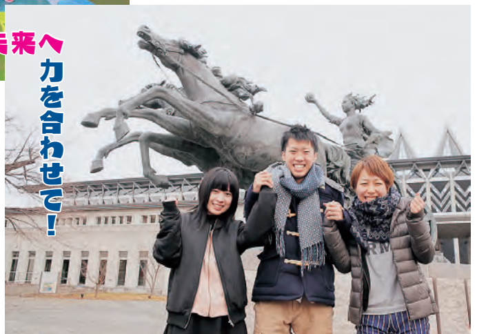
秋田公立美術大学の学生のみなさん