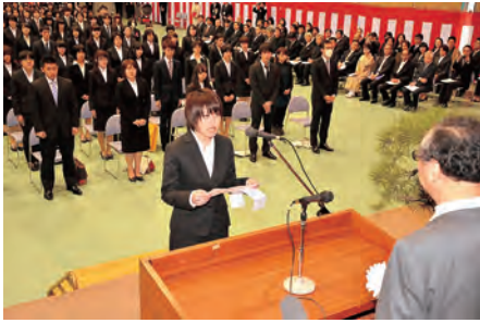
“秋美”初の入学式(昨年4月9日)

また、大学との共同研究や商品開発に取り組んだり、県内就職を希望する学生のインターンシップ(企業などでの就業体験)に協力してくださる企業や団体などで組織する、大学公認の支援組織“あきびネット”も間もなく発足する予定と伺っています。地域の力は、何よりも大学や学生の背中を押してくれるもの。引き続き地域に根ざした愛される大学となるよう本市としても支援していきたいと思えます。