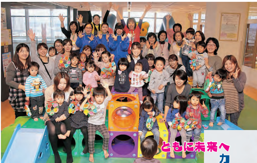
子ども未来センターで