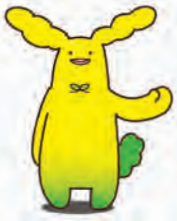
動物園のイメージキャラ「オモリン」

また、大学との共同研究や商品開発に取り組んだり、県内就職を希望する学生のインターンシップ(企業などでの就業体験)に協力してくださる企業や団体などで組織する、大学公認の支援組織“あきびネット”も間もなく発足する予定と伺っています。地域の力は、何よりも大学や学生の背中を押してくれるもの。引き続き地域に根ざした愛される大学となるよう本市としても支援していきたいと思えます。