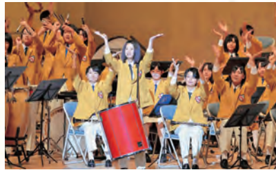
多彩なジャンルの曲で盛り上げます (昨年9月のイベントで)