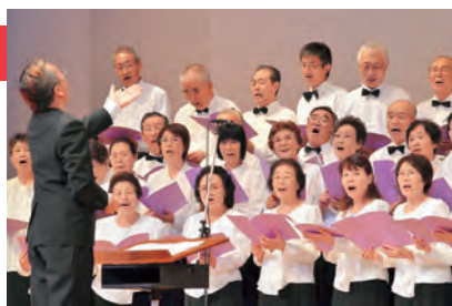
昨年開催したプレイベント「国文祭がやってくるヤア！ヤア！ヤア！」

「発見×創造」もうひとつの秋田」をテーマに、10月4日(土)から11月3日(月)の文化の日までの一か月間、県内市町村において70を超える事業を予定しており、本市では県内最多の12事業13イベントを主催します。