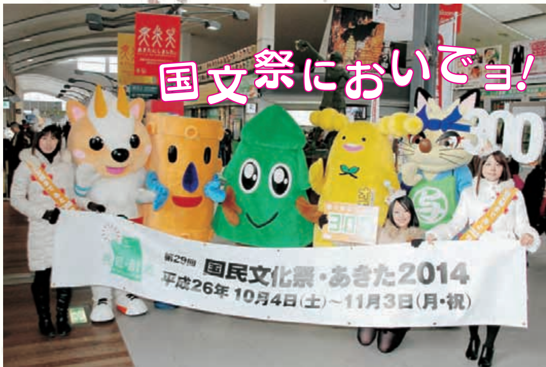
みんなも応援よろしくね！(昨年12月8日の300日前カウントダウンイベントで)