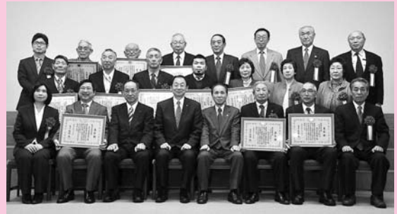
受賞者のみなさんと穂積市長