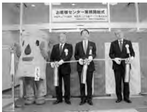
4月1日の業務開始式で

受託者は、秋田市上下水道サービス(株)。営業は午前8時30分～午後5時15分(平日)、電話は(823)8431。これからもよろしくお願ひします。