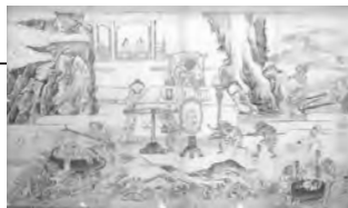
「地獄涅槃図下絵」 荻津勝章 筆