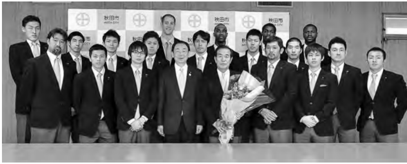
5月27日、ハピネットのみなさんが報告に訪れてくれました