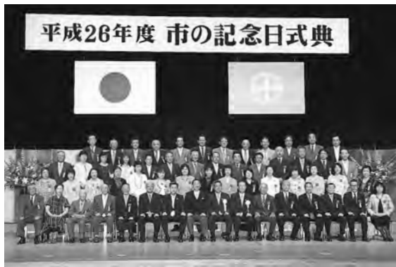
市の記念日式典で、功労者表彰を受けたみなさんと (7月11日、文化会館)