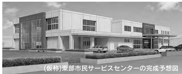
(仮称)東部市民サービスセンターの完成予想図

両日 ●喫茶(10:00～15:00) ●軽食(11:00～15:00) ●生涯学習相談(10:00～17:00。28日は15:00まで) ●作品展示、学習活動紹介、子ども縁日、野菜即売コーナー(以上9:00～17:00。28日は15:00まで)