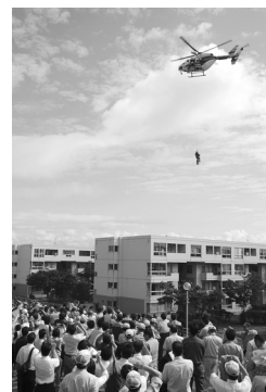
秋田市総合防災訓練で

教育の分野では今、中央教育審議会で、防災教育を学習指導要領に盛り込み、教科の一つにすることも視野に入れ、学校の授業でしっかり教えようという議論があります。各教科でバラバラに教える現状を見直し、年齢に応じて何ができるかを示す必要があるといっ