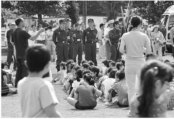
新屋地区で行われた秋田市総合防災訓練で(8月29日)