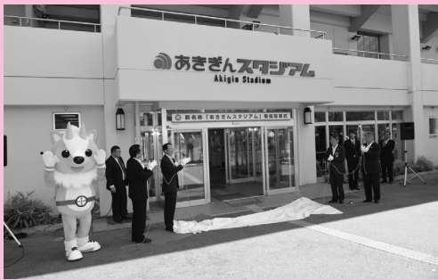
健康のつどいの会場となる「あきぎんスタジアム」の看板除幕式で(9月1日)