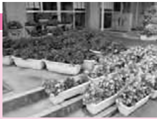
学校の部特別優秀賞の外旭川中学校の花壇

秋田市緑化コンクールに56団体と個人12人が参加し、各部門の入賞が次のとおり決まりました。カッコ内は地区協議会名です。