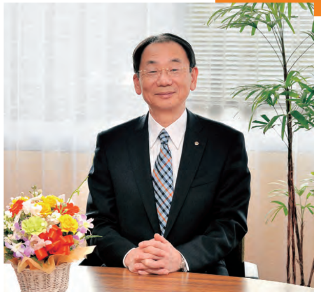
秋田市長 穂積 志