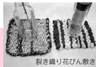
裂き織り花びん敷き

①生ごみ堆肥作り講座(各回30分)◆要申込◆先着各10人…EM菌バケツ、段ボール堆肥作り、コンポスターを使った堆肥作り。EM菌バケツと段ボール堆肥作りの受講者には基材一式を提供します