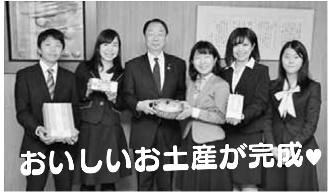
おいしいお土産が完成♡