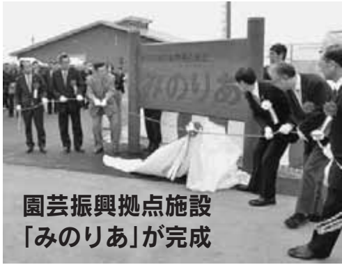
園芸振興拠点施設「みのりあ」が完成