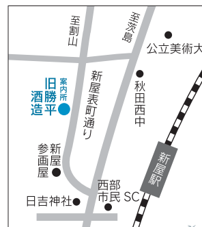
当日の案内所と周辺地図

*FAXの申込書は、ホームページから入手するか、観覧席予約センターへお問い合わせください。☎(824)8686