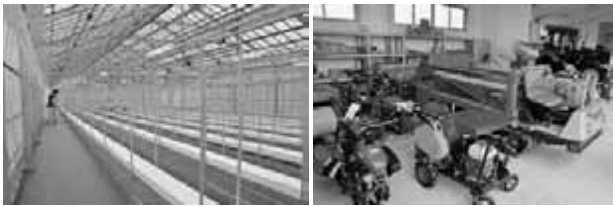
温室や農機具なども完備