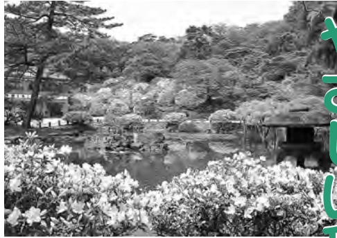
彩り豊かな千秋公園