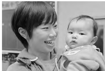
10ページのだまこもちのイベントで

当日10:00から、同会場で竿燈の組み立てを実演します。「いほ結び」「十字結び」など、普段なかなか見ることができない伝統の技をじっくりご覧ください。