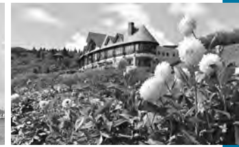
秋田国際ダリア園