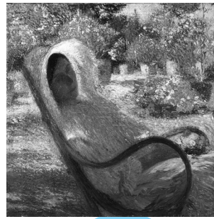
◀アンリ・マルタン「緑の椅子の肖像、マルタン夫人」1910年 個人蔵