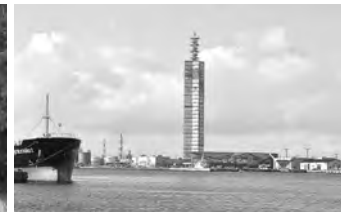
ポートタワーセリオン