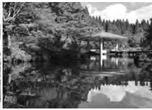
小泉瀉公園水心苑