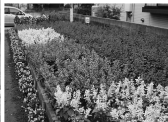
町内の部・特別優秀賞の仁井田新田若栄町町内会(右)と栄町町内会