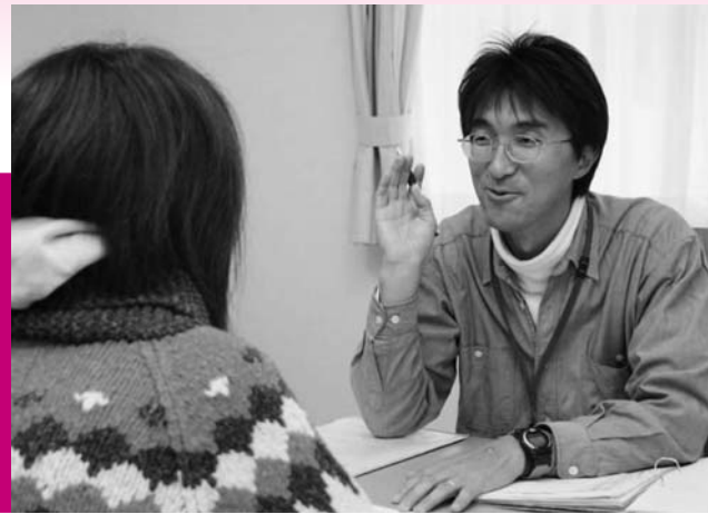
“話をよく聞く”ことを心がけています

柳田字竹生168 ☎(834)2577 ファクス(834)2219 Eメール tk-sien@ikumei.or.jp