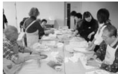
創作活動のメニューもあります

65歳以上で要支援・要介護認定を受けてないかたが対象の介護予防教室です。下記の会場で行います。参加無料(一部実費負担あり)。定員は各会場20人。送迎はありません。