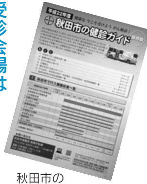
秋田市の健診ガイド