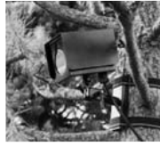
不法投棄監視カメラ「みてるくん」

市では不法投棄を防止するため、毎日パトロールしています。監視カメラ「みてるくん」も監視中です。不法投棄を見つけた場合は廃棄物対策課へご連絡ください。