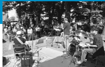
昨年も熱いライブが繰り広げられました

9月4日(土)・5日(日)に大町で開催するストリート音楽ライブ「P・M・A」の出演者を募集! 年齢、プロ・アマは問いません。参加費は1団体4人まで3,000円(5人以上は1人500円をプラス)。