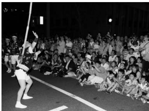
今年の竿燈も大勢の観光客でにぎわいますように

ほかにも観光アドバイザーの起用や観光時事故談の開催、ホームページの一新など、さまざまな取り組みがあります。詳しくは広報あきた6月18日号2、3ページをご覧くださいと思います。 また、先ごろ東京の下町浅草で竿燈をあげてきたことは前にもお伝えしましたが、実際に行動に移したことで見えてきたことがたくさんあります。私は秋田の観光の中で竿燈だけは全国的にもその名を馳せて…と想っていたのです