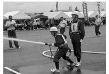
訓練の成果が発揮されました

7月11日、御所野の消防訓練場で秋田市消防団消防操法大会が行われました。各部門の優勝分団は、9月2日(木)に由利本荘市の秋田県消防学校で開かれる全県大会に秋田市代表として出場します。市消防本部警防課 ☎(823)4243