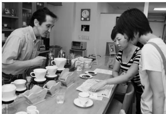
シートを見ながら店巡り。次回は10月に開催予定