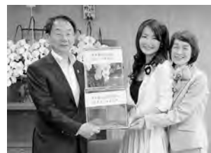
5月30日の義援金贈呈式で

少し…。広報あきたを読んでいて、地域とのつながりが浅い自分を発見しました。これからは、少し地域に目を向けていろいろなことに参加していきたいと思います (つくつん 48歳・八橋) ●竿燈まつりの写真を見ました！今年も最終日(8月6日)の圧倒的な迫力を見たいと思っています。秋田の夏の風物詩ですね！ (ちーちゃた 27歳・茨島) ●気温が上がってきて、わが家も夏支度を始めました。塩入の麦茶に緑のカーテン：暑いのは苦手ですが、何だか楽しみです♪(塩パン 29歳・牛島)