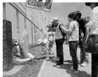
にぎわい交流館横にある「明治天皇聖蹟」の碑の前で

が、「文化財たつぷり」「羽州街道」「千秋公園」の3つのコースにわかれ、約1時間半の散策を楽しみました。