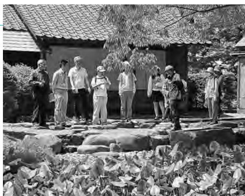
千秋公園は史跡の宝庫！茶室宣庵の庭には、船形の手水鉢(写真右端)があり、これは、加藤清正が朝鮮から持ち帰ったものと伝えられています

http://www.city.akita.akita.jp/city/ed/cl/illust-map/