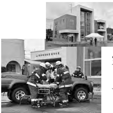
開署式で救助訓練を披露