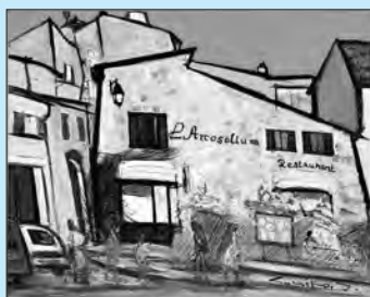
作品名「レストラン」