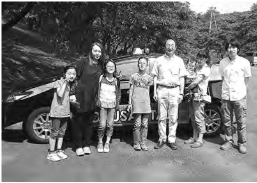
観光myタクシーで、ほのほのした 出会いも♪(河辺へそ公園で)