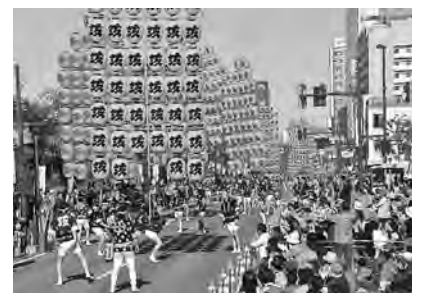
パレードのクライマックスは竿燈演技。3日間の来場者は12万9千人でした！