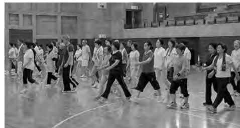
「歩くべ! あきた!」(シニア編)のスタートイベントで(8月24日)