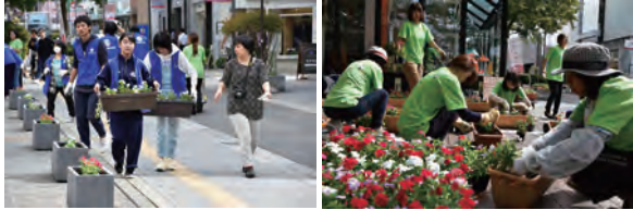
きれいなお花で“ウェルカム♪”

仲小路商店街の協力のもと、日本女性会議2016秋田の実行委員会メンバーと秋田明德館高校生徒会のみなさんが、各会場をつなぐ仲小路にプランターを備えつけました！