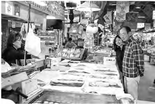
イカ、ウニ、イクラ…食材を吟味中♪