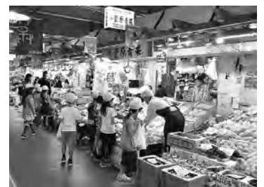
旬の食べ物がたくさん！ 食育の場にピッタリですね

戦後まもなく秋田駅前に誕生した青空市場を前身とする秋田市民市場。高齢化や核家族化といった時代の変化に伴って、新たな取り組みも行われています。高齢者にやさしい社会をめざすエイジフレンドリーパートナーとして、商業者が休憩用のベンチや車いすを設置しているのもその一例です。電話や