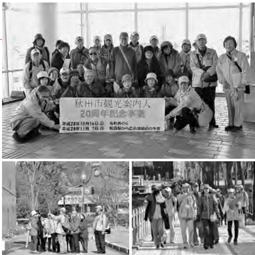
3班に分かれて晩秋の広小路を散策♪

この日のコースは、秋田駅→中土橋→佐竹小路→旧産業会館跡地→エリアなかいち→西口大屋根下の順。昔の写真を使った案内人の分かりやすい説明とうんちくに、参加者は「んだんだ、あの建物ここにあった」「広小路、歩行者天国だったな」など、街の移り変わりを懐かしんでいました。