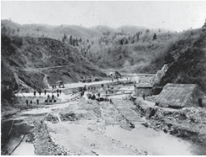
上の写真は、藤倉水源地建設当時の様子。下は現在