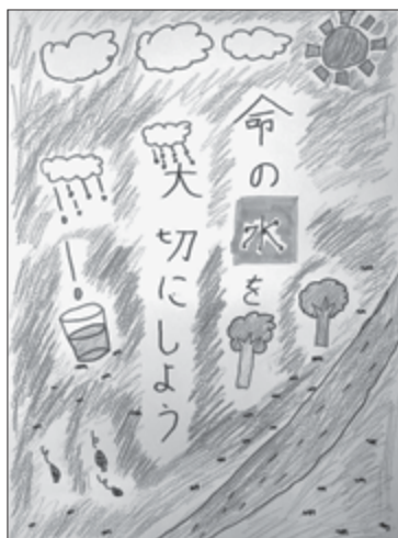
平成28年度最優秀作品

◆蛇口を閉めてもパイロットが回転している場合は漏水の可能性がります。回転していなくても、不安を感じたらお客様センターへお問い合わせください。