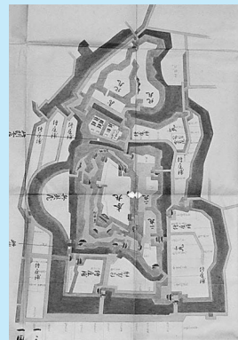
出羽国秋田居城絵図 弘化4年